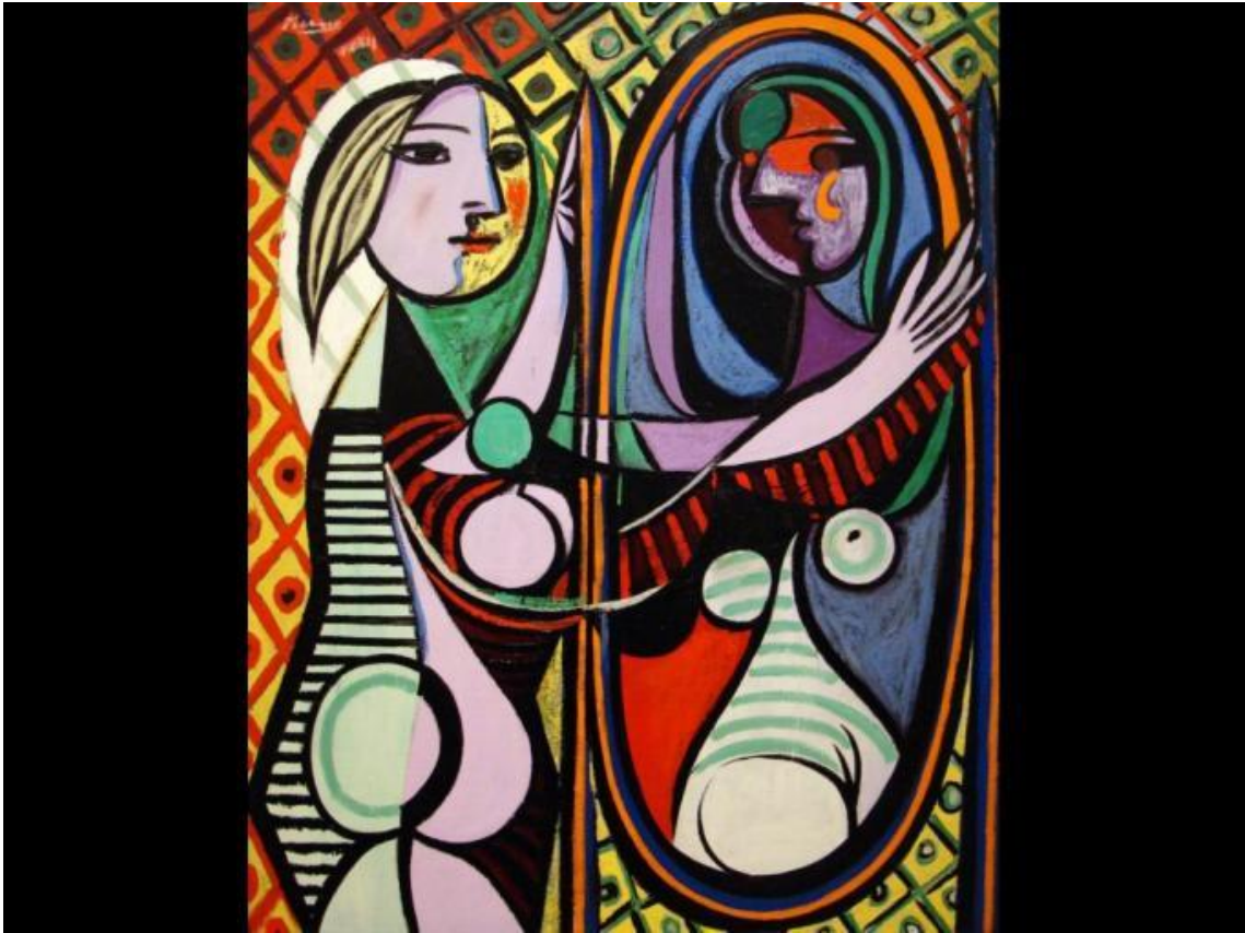
Mujer ante el espejo (1932)