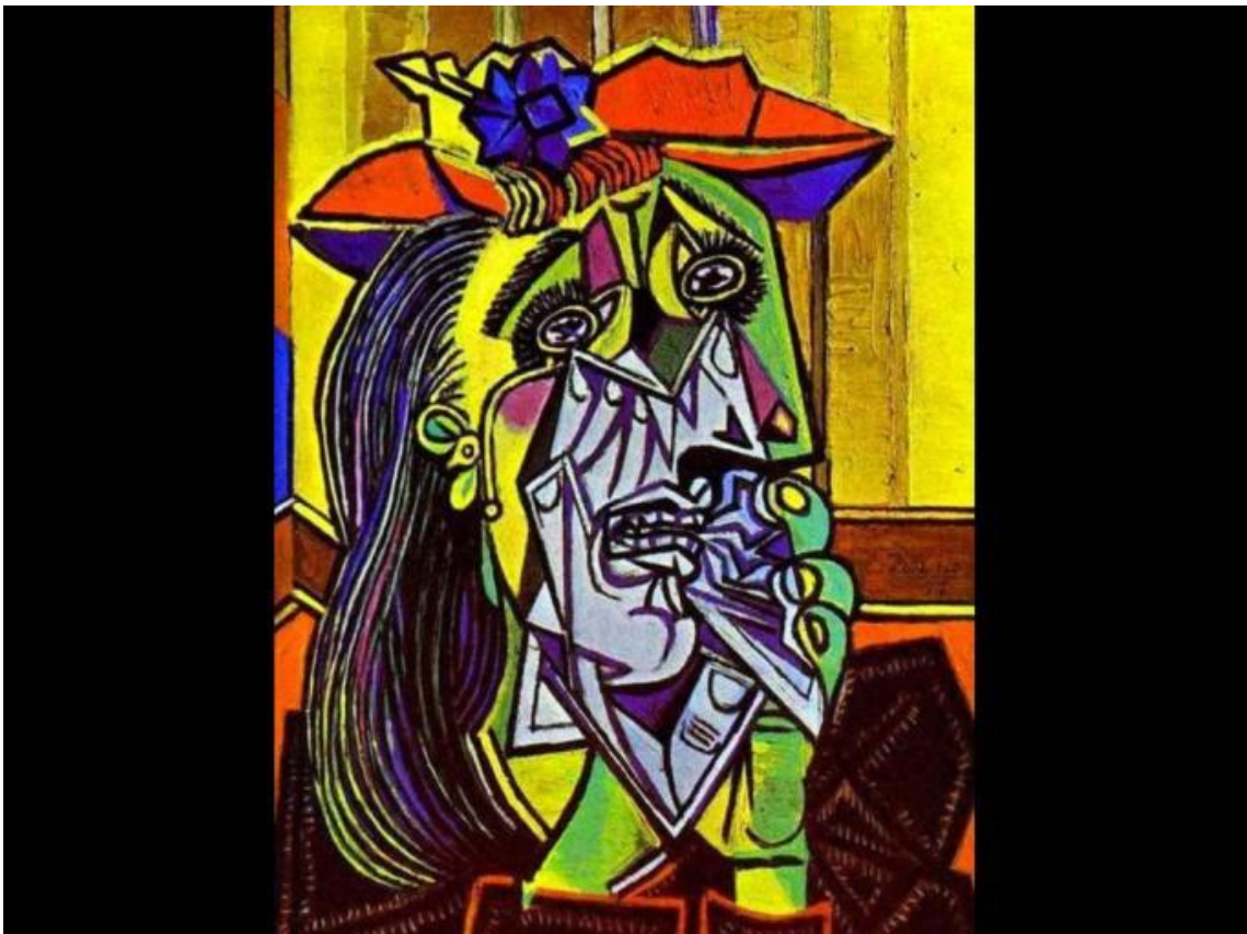
La mujer que llora (1937)