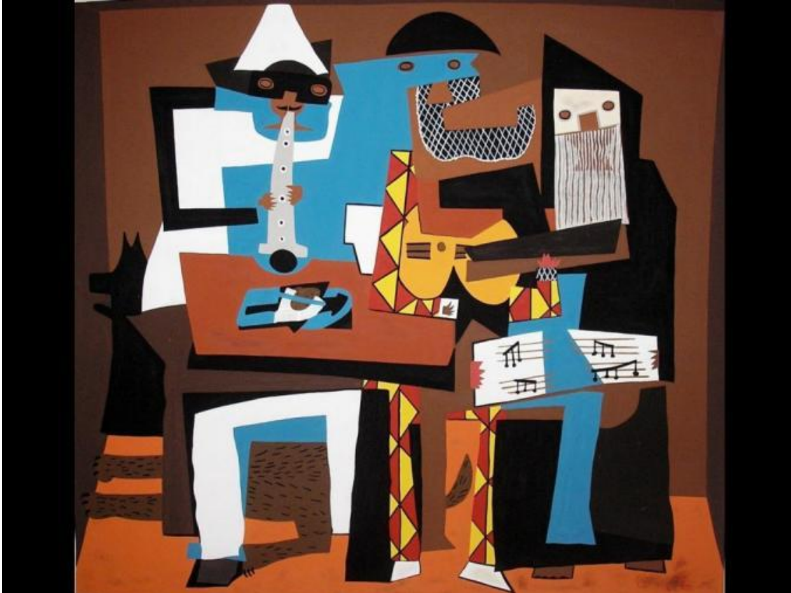
Los tres músicos o Músicos con máscaras (1921)

Pone punto y final al período del Cubismo Sintético para comenzar con el cubismo analítico.