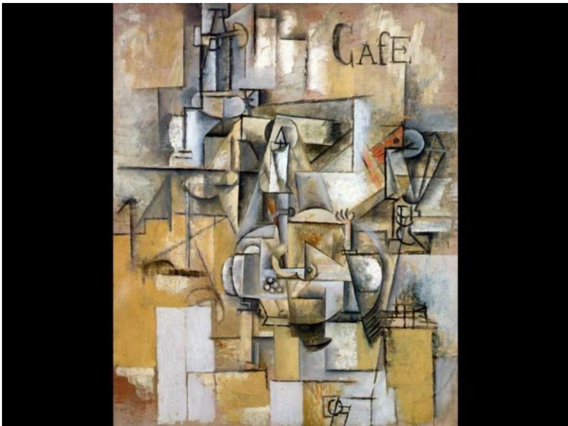
Le pigeon aux petits pois (1911)

Varias figuras geométricas sobre un fondo de color ocre, con la palabra 'café' en letras mayúsculas.