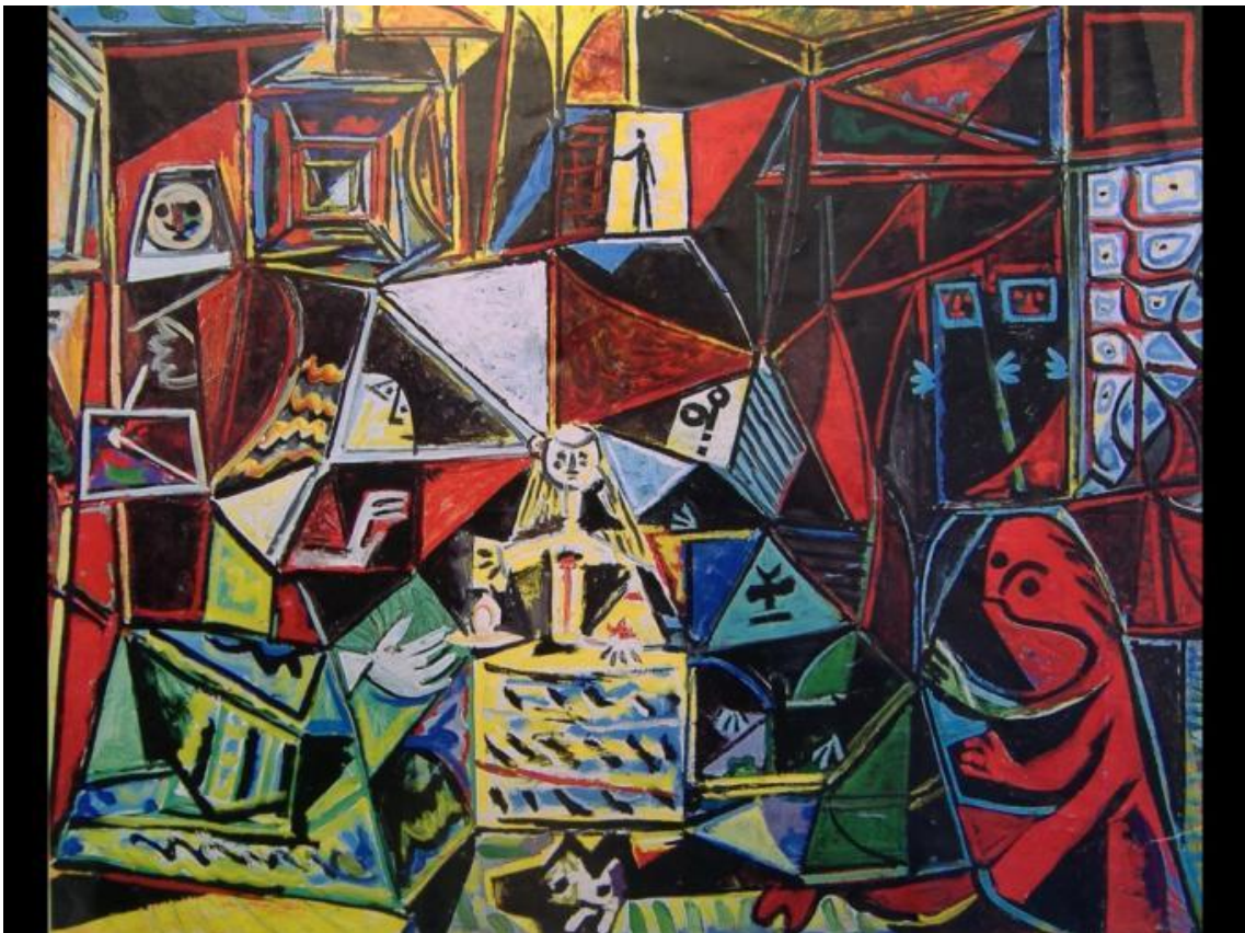
Las Meninas (1957)

En 1958 Picasso renovó el préstamo del cuadro al MoMA por tiempo indefinido, hasta que se restablecieron las libertades democráticas en España. La obra regresó finalmente a España en el año 1981.