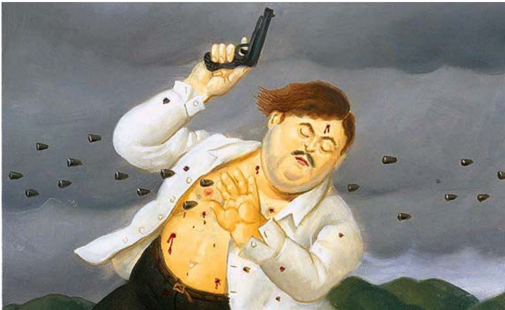
Pablo Escobar muerto