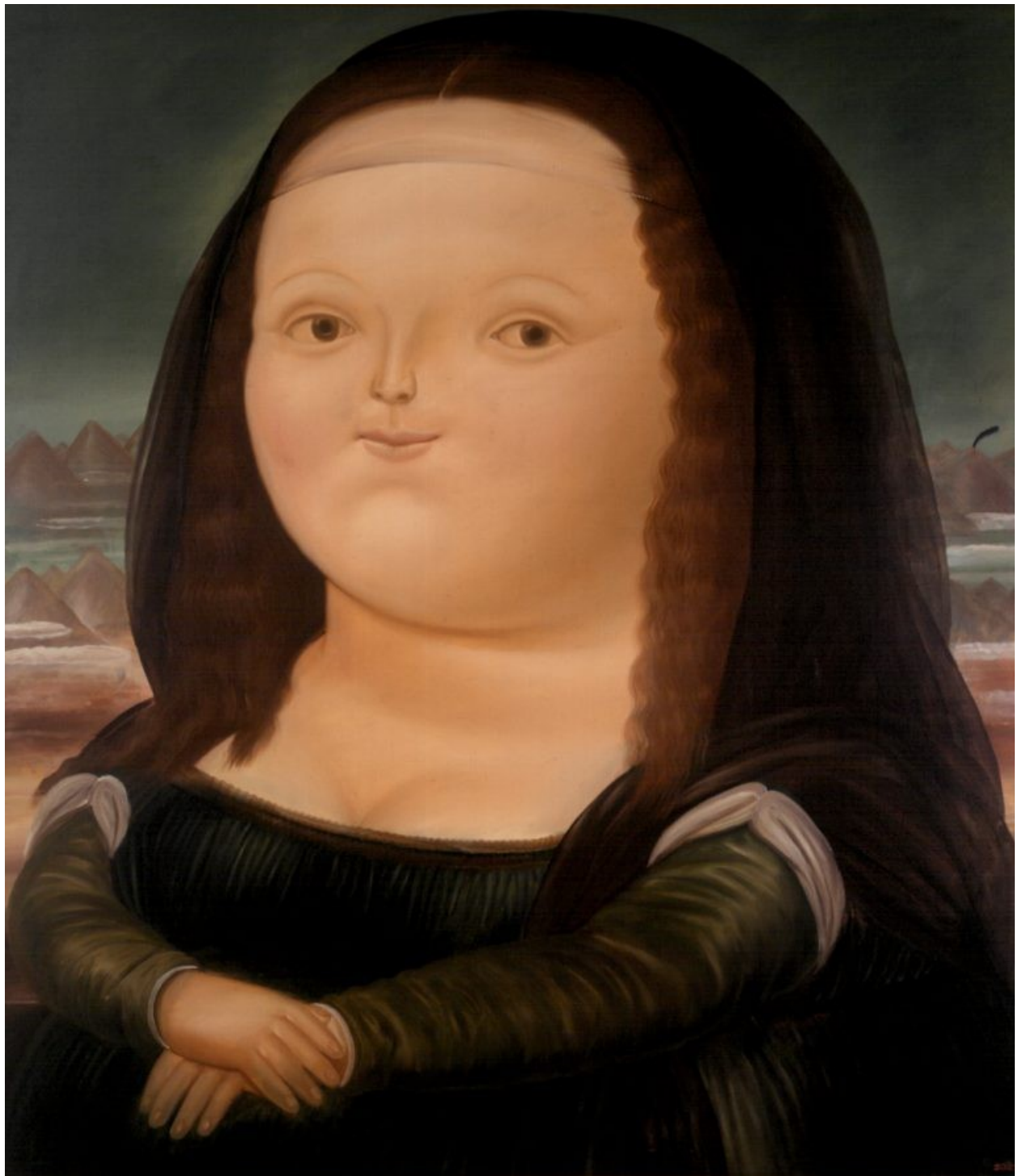
Mona Lisa (1978)

La Mona Lisa es un clásico trabajo representativo de Fernando Botero. Es la pintura más notable de Botero. Botero ha pintado muchas piezas de Mona Lisa, por ejemplo, Mona Lisa a los 12 años, es una pintura imaginativa que retrató Mona Lisa en la infancia, mientras que esta Mona Lisa es su obra maestra, cuya composición es la misma que la de Leonardo da Vinci.