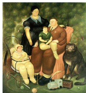
Escena de familia