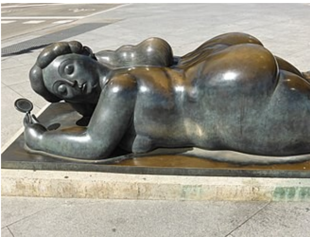
Mujer con espejo