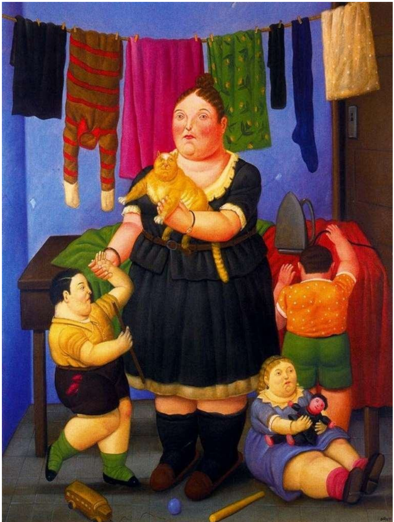
La viuda (1997)

Presenta a una mujer que ha quedado viuda con sus tres hijos pequeños. Las figuras de este cuadro están bastante detalladas y en la mujer por ejemplo se pueden apreciar la tristeza.