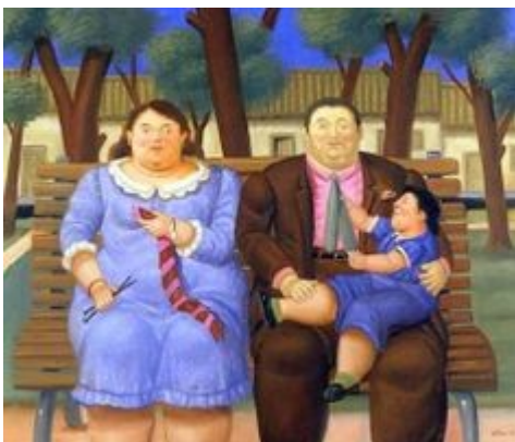
En el parque